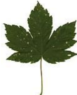
Acerò di monte