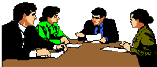
Tavola Rotonda "Le Cellule Staminali" Domenica 12 maggio 2002

L'ANED Comitato Friuli-Venezia Giulia con l'AIDO (Associazione Italiana per la Donazione di Organi e Tessuti), l'ACTI (Associazione CardioTrapiantati Italiani) e con Amare il Rene organizzano una Tavola Rotonda che approfondirà un tema di rilevanza mondiale e di grande attualità: l'utilizzo delle cellule staminali come terapia. L'argomento verrà trattato da relatori altamente qualificati, chiamati a confrontarsi dal punto di vista scientifico, sanitario ed etico. La sede sarà la Sala Conferenze della Scuola Superiore di Lingue Moderne per Interpreti e Traduttori sita in via Filzi 14, a partire dalle ore 9.00 di domenica 12 maggio p.v.. Già da anni il nostro Circolo ha dimostrato una particolare sensibilità per tutto ciò che riguarda la "Cultura della Donazione" tema che, secondo noi, va affrontato e pubblicizzato anche nel nostro ambiente dopolavoristico ed associativo. E' per questo motivo che ci è sembrato giusto contribuire alla buona riuscita di questa iniziativa: un caloroso grazie va anche al prof. Lucio DELCARO, Magnifico Rettore ed al prof. David Clyde SNELLING, Preside della Scuola Superiore di Lingue Moderne per Interpreti e Traduttori. Tutti sono invitati a partecipare alla Tavola Rotonda.